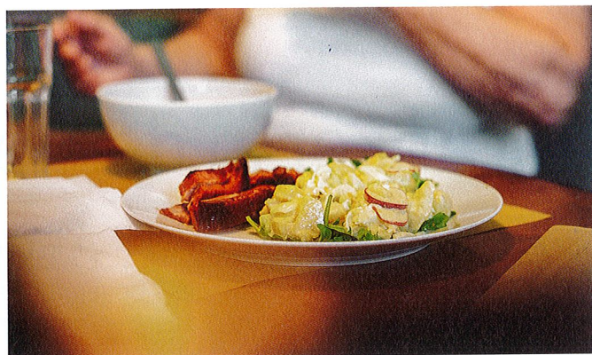
Der Mittagstisch beim Sozialwerk Hope ist immer gut besucht.